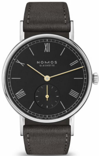
Nomos Ludwig 33 noir, Edelstahl, Handaufzugwerk, ø 33 mm, goldene Zeiger auf schwarzem Blatt, Velourslederband