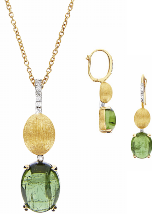
Collier (42 cm), 750/- Gelbgold, Turmalin, 9 Brillanten 0,04 ct. FW vsi Ohrschmuck, 750/- Gelbgold, Turmalin, 12 Brillanten 0,08 ct. FW vsi Anhänger, 585/- Gelbgold, Turmalin, 5 Brillanten 0,19 ct. FW vsi Kette (42 cm), 585/- Gelbgold Ring, 585/- Gelbgold, Turmalin, 4 Brillanten 0,15 ct. FW vsi Ring, 585/- Gelbgold, Turmalin, 4 Brillanten 0,15 ct. FW vsi

1.880,- € 2.360,- € 936,- € 294,- € 1.060,- € 1.129,- €