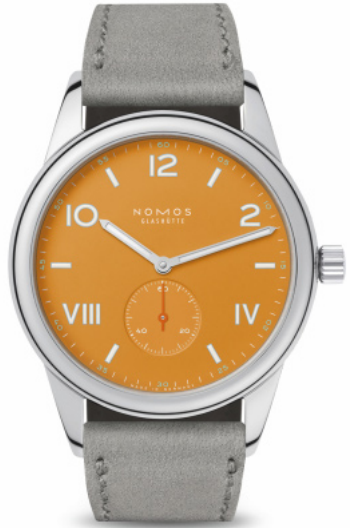
Nomos Club Campus Future Orange, Edelstahl, Handaufzugwerk, ø 36 mm, bis 10 bar wasserdicht, Velourslederband