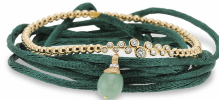
Flexibles Armband, 750/- Gelbgold, 13 Brillanten 0,29 ct. FW si Armband, 750/- Gelbgold, Aventurin, 3 Brillanten 0,01 ct. FW vsi, Seidenband Flexibles Armband, 750/- Roségold, Chrysopras, Jade, pink Opal Flexibles Armband, 750/- Roségold Flexibles Armband, 750/- Roségold, Aquamarin, Jade Ring, 750/- Gelbgold, Aventurin, 10 Brillanten 0,06 ct. FW vsi Ring, 750/- Gelbgold, Aventurin, 8 Brillanten 0,03 ct. FW vsi

4.150,- € 360,- € 798,- € 2.700,- € 798,- € 1.690,- € 990,- €