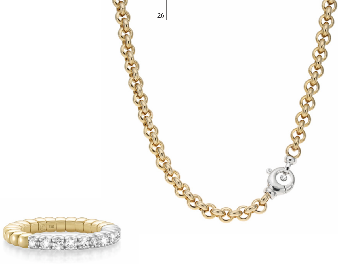
Flexibler Ring, 750/- Gelb-/Weißgold, 9 Brillanten 0,58 ct. FW vsi 3.980,- € Collier, 750/- Gelb-/Weißgold, 1 Brillant 0,05 ct. FW vsi 5.698,- €

Konzept, Grafik und Realisation: www.typonetris.de